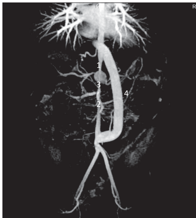
Slika 2. Angiografski prikaz, tip IV., Takayasuov arteritis.

Prva naša bolesnica imala je prema suvremenim klasifikacijama koje se danas koriste (3,5,6) tip II. a koji se očituje klinički znatnim suženjem aortnih ogranaka i torakalne aorte ispod samog istmusa aorte. Bolesnica je prepoznata