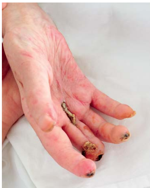
SLIKA 2. Promjene prstiju desne šake: teleangiektazije palmarno, sklerodaktilija, stanje nakon amputacije distalne falange trećeg prsta, digitalne ulceracije vrhova prstiju

FIGURE 1 Changes in the fingers of the left hand: palmar telangiectasia, sclerodactyly, dry gangrene of the distal phalanx of the index finger