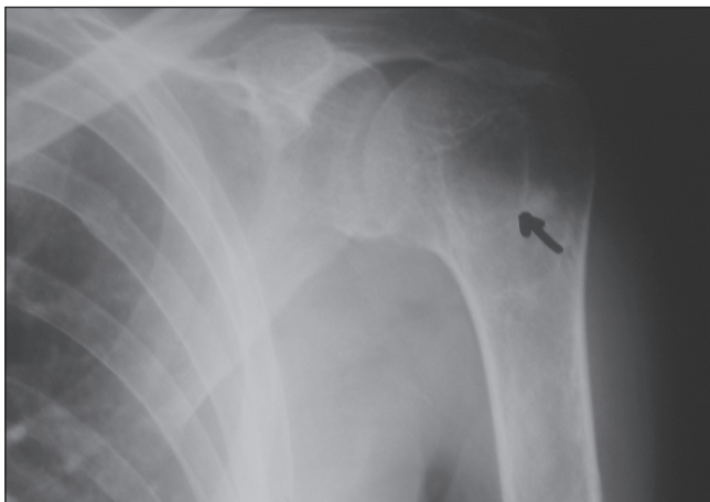
Slika 1. Cistična tvorba u glavi desnog humerusa sklerotičnih rubova, promjera 2×1 cm Figure 1. Cystic formation with sclerotic rubs of the right humerus head, diameter 2×1 cm

U svibnju 2001. godine zbog jakih bolova u mišićima udova, zdjelničnom pojasu i prsnom košu obraća se fizijatru. Pri dolasku bolesnica je bila nepokretna, s